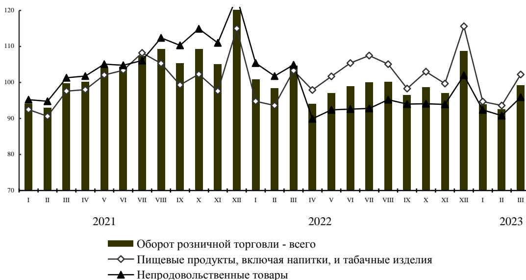
Динамика оборота розничной торговли (в процентах к среднемесячному значению 2020 г.)

Оборот общественного питания , с учетом деятельности индивидуальных предпринимателей, составил 1,2 млрд рублей, или 101,7% (в сопоставимых ценах) к январю-марту 2022 г.